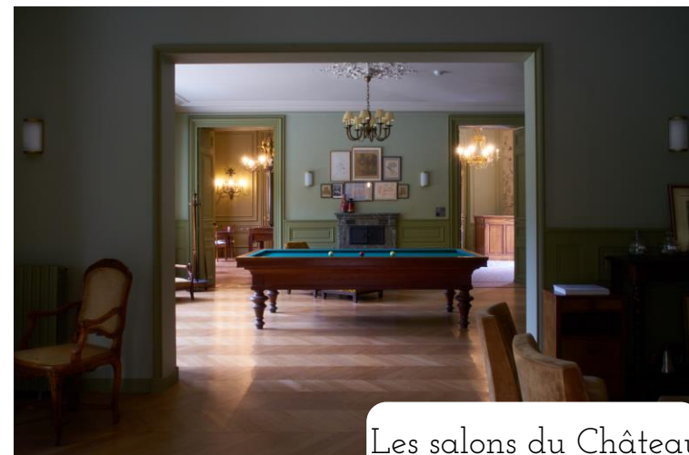
Les salons du Château